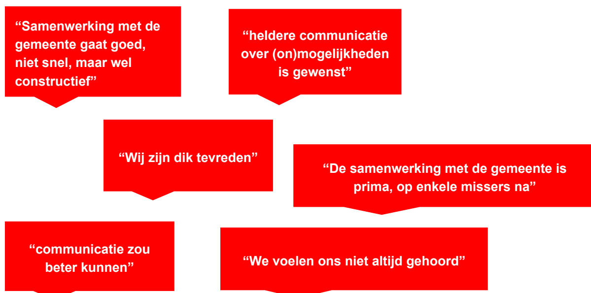
Figuur 1 enkele quotes van zelfbeheerders over het huidige beleid

Wij willen de bestaande zelfbeheerinitiatieven beter faciliteren door ten eerste als gemeente beter inzicht te krijgen in wat er speelt in de samenleving: wat zijn de wensen en (ondersteunings)behoeften van zelfbeheerders? Het gaat nu al best goed. Dat blijkt ook uit een korte enquête, die wij onder zelfbeheerders hebben uitgezet. In bijlage 3 hebben wij een overzicht van de belangrijkste resultaten uit deze enquête bijgevoegd. Hieruit blijkt ook dat zelfbeheerders suggesties hebben over hoe het nog beter kan. Het is daarom voor een goede uitvoering van belang om breed in gesprek te gaan met zelfbeheerders en in gesprek te blijven om de uitvoering van het beleid optimaal afstemmen op de wensen en behoeften van zelfbeheerders. Wij willen dit realiseren door de uitvoering van het actieplan af te trappen met (digitale)wijkbijeenkomsten voor zelfbeheerders (maatregel 1) en daarbij te verkennen of we als gemeente moeten investeren in nieuwe ondersteuningsmogelijkheden (maatregel 2).